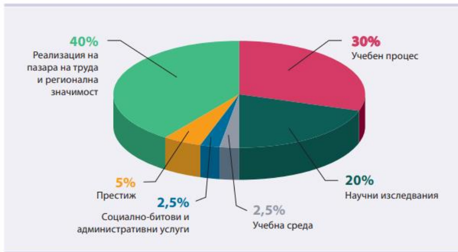
Фиг. 1. Стандартизирана класация „Комплексна оценка 2019“

Стандартизираните класации по професионални направления са изработени на базата на предварително избрани индикатори. В диаграмата по-долу може да се види разпределението на тежестите на отделните групи индикатори.